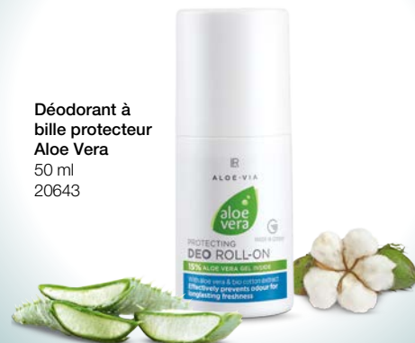
Déodorant à bille protecteur Aloe Vera 50 ml 20643

sans alcool, le déodorant à bille peut être appliqué directement après le rasage.