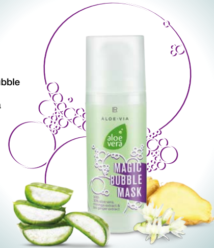
Magic Bubble Mask Aloe Vera 50 ml 20789

Dès qu'il est appliqué, le gel se transforme, en quelques secondes, en une mousse composée de minuscules bulles crépitantes qui permettent d'emporter plus facilement les impuretés et de faire pénétrer plus profondément les ingrédients actifs dans la peau. L'extrait de gingembre et l'extrait de moringa débarrassent la peau des petites peaux mortes et des polluants. De plus, le masque, par son effet rappelant le lotus, empêche l'accumulation d'autres substances nocives tandis que l'Aloe Vera hydrate intensément et aide la peau à se régénérer.