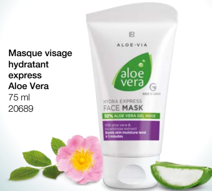
Masque visage hydratant express Aloe Vera 75 ml 20689

UNE HYDRATATION MIRACLE POUR LE VISAGE : appliquez une quantité généreuse sur le visage, le cou et/ou le décolleté nettoyés et laissez pénétrer pendant 3 minutes. Enlevez l'excédent à l'aide d'un coton. Le masque agit avec une combinaison particulière d'actifs comme un miracle d'hydratation : La teneur de 50 % de gel d'aloë vera hydrate bien la peau sèche et irritable. Aquapront™ comble les rides, diminue les pores et améliore le grain de peau immédiatement après l'application. Aquaxyl™ est particulièrement doux, réduit la perte en eau et la peau est visiblement hydratée. Le Panthénol améliore l'hydratation et la retient.