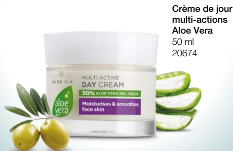
Crème de jour multi-actions Aloe Vera 50 ml 20674